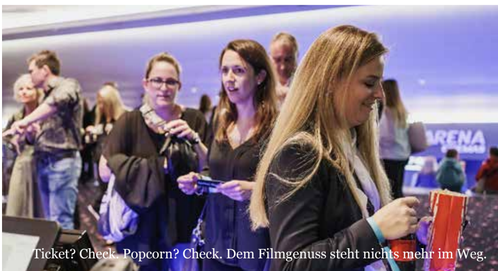
Ticket? Check. Popcorn? Check. Dem Filmgenuss steht nichts mehr im Weg.