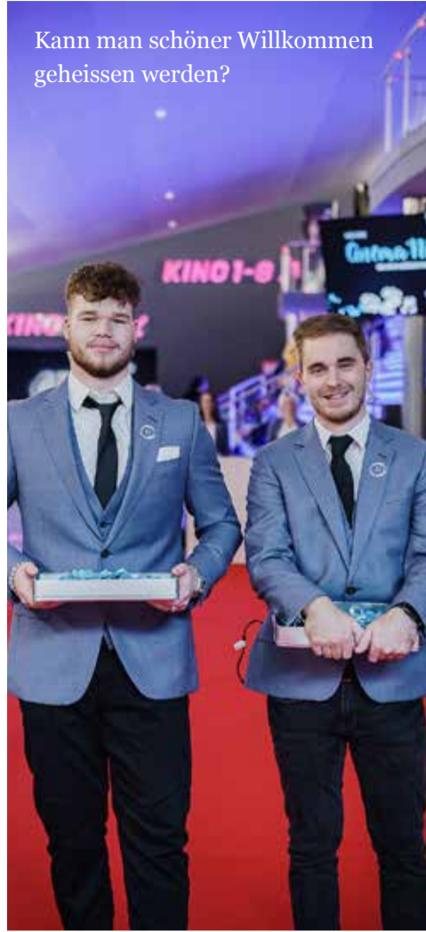
Kann man schöner Willkommen geheissen werden?