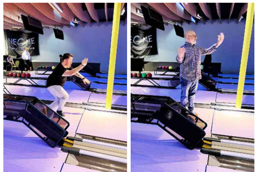
Sieg und Niederlage liegen nah beieinander– und manchmal braucht es auch ein Quäntchen Glück.