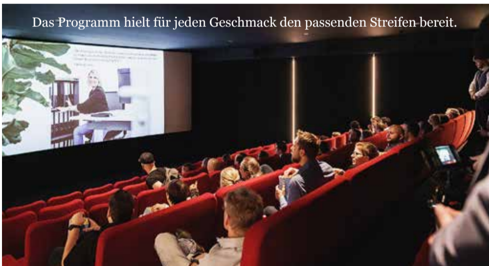
Das Programm hielt für jeden Geschmack den passenden Streifen bereit.