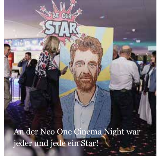
An der Neo One Cinema Night war jeder und jede ein Star!