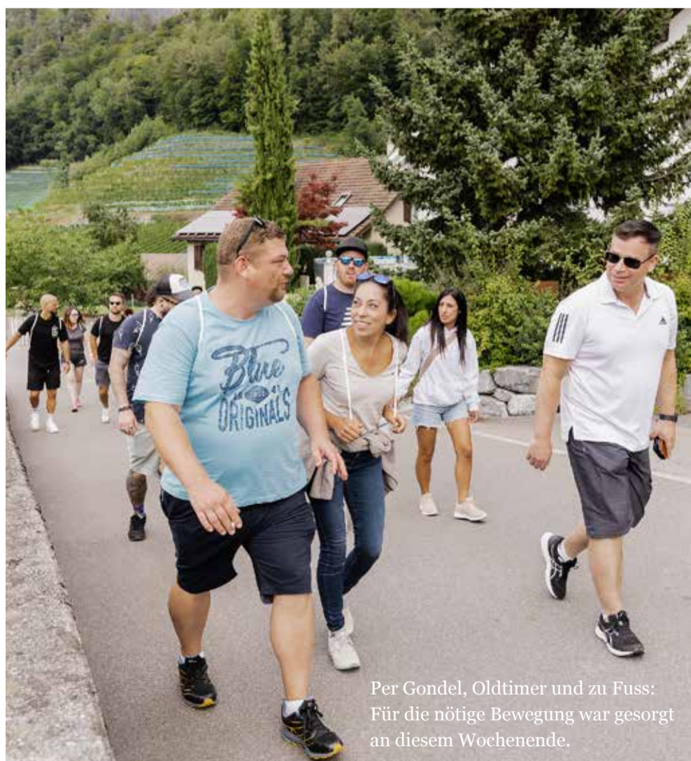
Per Gondel, Oldtimer und zu Fuss: Für die nötige Bewegung war gesorgt an diesem Wochenende.